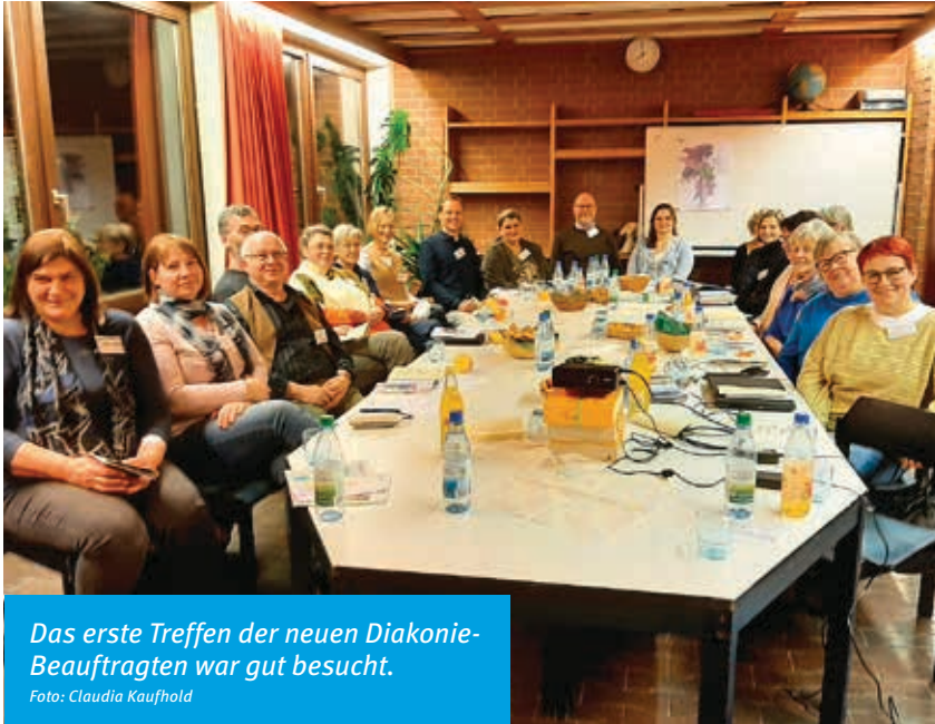
Das erste Treffen der neuen Diakonie-Beauftragten war gut besucht.