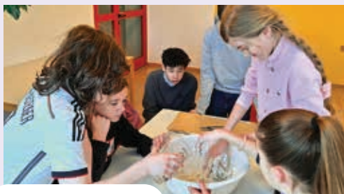
Backen der Hostien