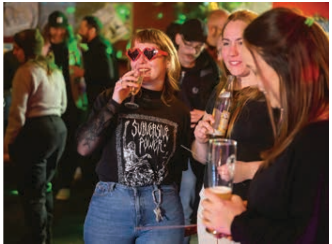
Im Immerhin unterwegs.