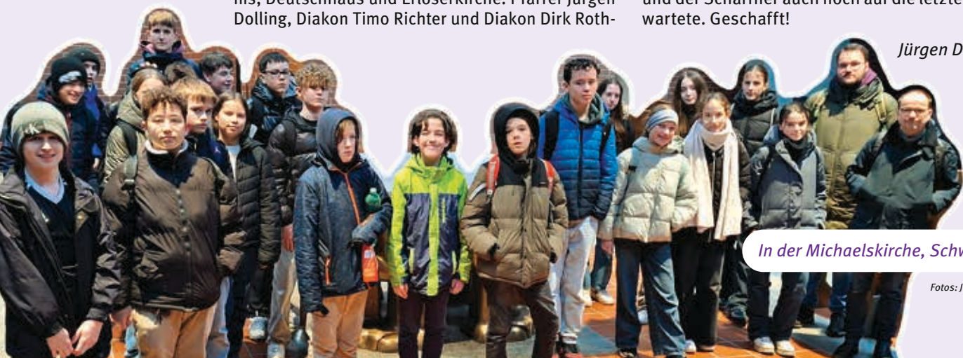
In der Michaelskirche, Schwanberg